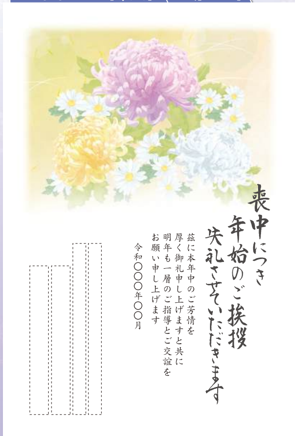
MN-019 イメージ[菊(キク)] 文例[M-802]